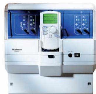
Logamatic 4121 szabályozó FM442 modullal